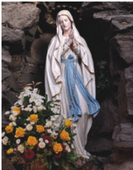
«Gegrüsst seist du, Maria, voll der Gnade, der Herr ist mit dir.» (Lourdeskapelle, Grub SG)